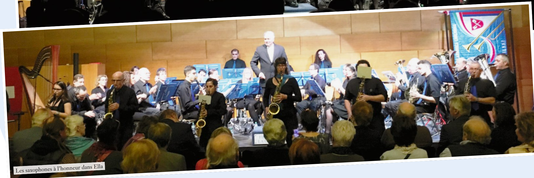
Les saxophones à l'honneur dans Ella